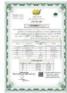
مجوز تولید نهال گروه محصولی غیر میوه‌ای