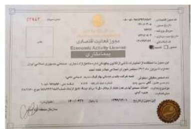
مجوز فعالیت اقتصادی در منطقه آزاد جزیره کیش