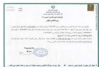
گواهینامه تایید صلاحیت ایمنی ACS