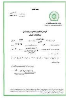
گواهینامه تشخیص صلاحیت و رتبه بندی (سازمان نظام مهندسی کشاورزی و منابع طبیعی)