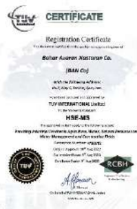
استاندارد سیستم ایمنی و بهداشتی