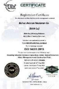
استاندارد سیستم مدیریت زیست محیطی