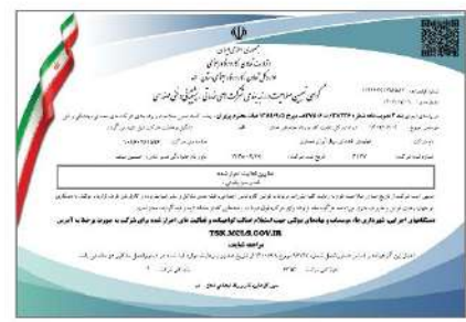
گواهینامه صلاحیت اداره کار