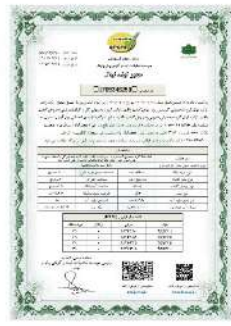
مجوز تولید نهال گروه محصولی گرمسیری به روش کشت بافت