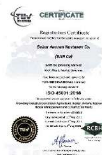
استاندارد سیستم سلامت و بهداشتی