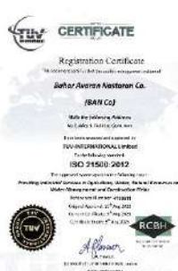
استاندارد سیستم بهبود عملکرد مدیریت پروژه