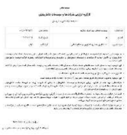
گواهینامه ثبت دانش بنیان