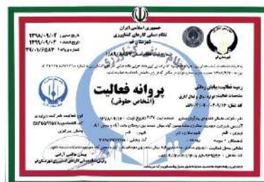
پروانه فعالیت نظام صنفی کشاورزی (جهاد کشاورزی)