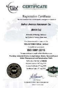
استاندارد سیستم مدیریت و کیفیت