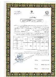
پروانه تاسیس مکانیزاسیون (جهاد کشاورزی)