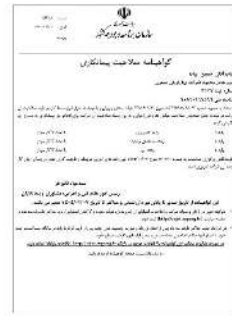
گواهینامه تشخیص صلاحیت و رتبه بندی (سازمان برنامه و بودجه کشور)