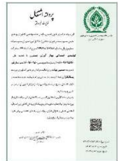
پروانه اشتغال (سازمان نظام مهندسی کشاورزی و منابع طبیعی)